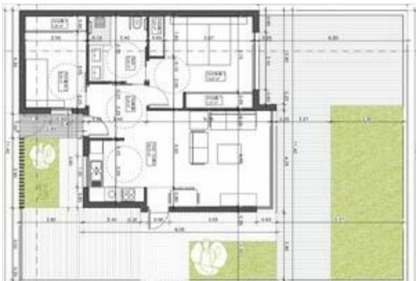
Avenida de Bruselas 18, Terrazas del Duque 1, Locales 13 - 14, Costa Adeje, 38660, Tenerife, España