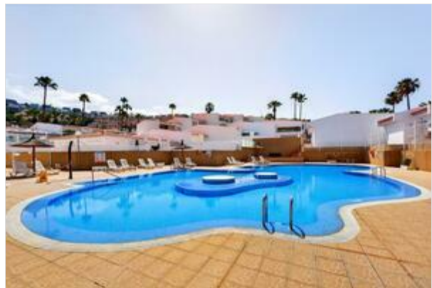
Avenida de Bruselas 18, Terrazas del Duque 1, Locales 13 - 14, Costa Adeje, 38660, Tenerife, España